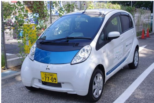
三菱自動車の「i-MiEV (アイミーブ)」

このたび当社では環境に配慮し、社用車として電気自動車1台を導入いたしました。 9月9日の納車に伴い、社内における内覧・操作説明会を行いました。