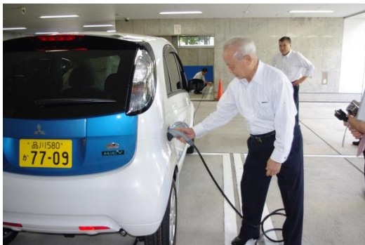
充電用ケーブルを接続